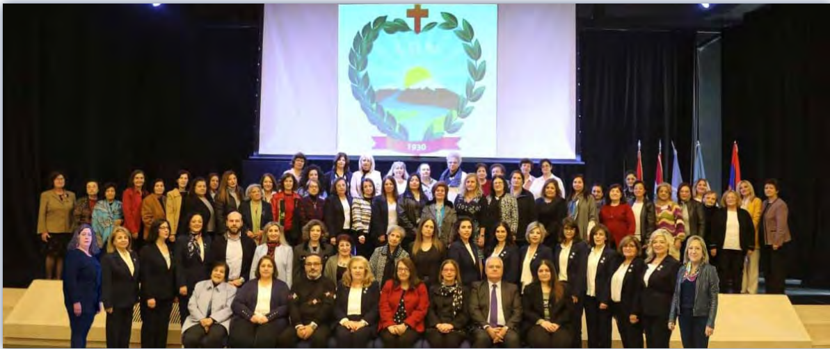
ԼՕԽԻ 62-րդ Պատգամատրական Բացառիկ Ժողովի շարունակություն

trips. The center also holds Christmas programs for needy children.