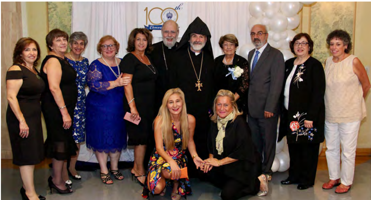
ARS EUSA 100th Convention