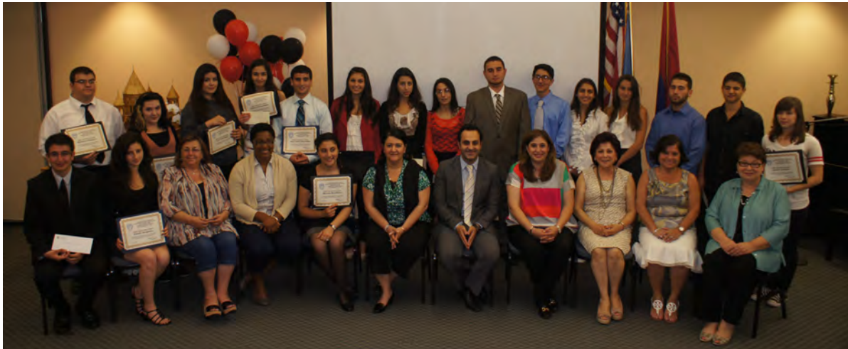
ARS High School Outstanding Student Awards Night 2012

of a bit of distance is nothing if your intention is a lifelong friendship.