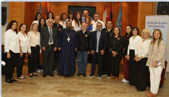
Երրորդ տարին ըլլալով Ֆրեզնոյի Հայ բժշկական առաքելութիւնը Անվճար սպասարկութիւններ մատուցեց ԼՕԽ դիմող հայորդիներու: