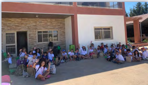
ԼՕՄի «Ա. եւ Ա. Գլայաշեան» Կազմուրման Կայանին մէջ - Այնճար իրենց մասնակցութիւնը բերին 6էն 12 տարեկան 50 փոքրիկներ