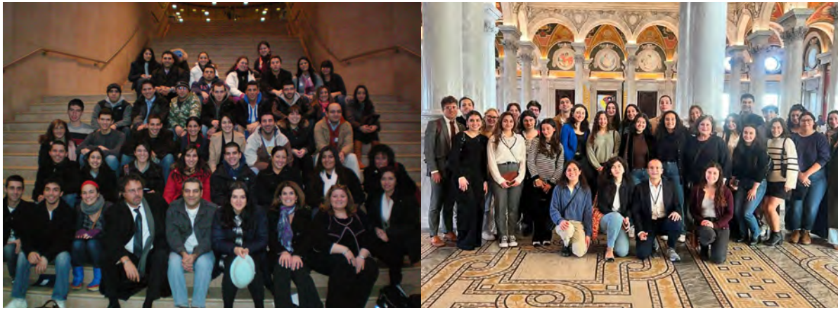
ARS Norian 1st YCP 2010 & ARS Norian YCP 2024

and cinema, has become the summer gathering place for Armenian students eager to discuss, study, and appreciate their heritage in both its past and modern aspects.