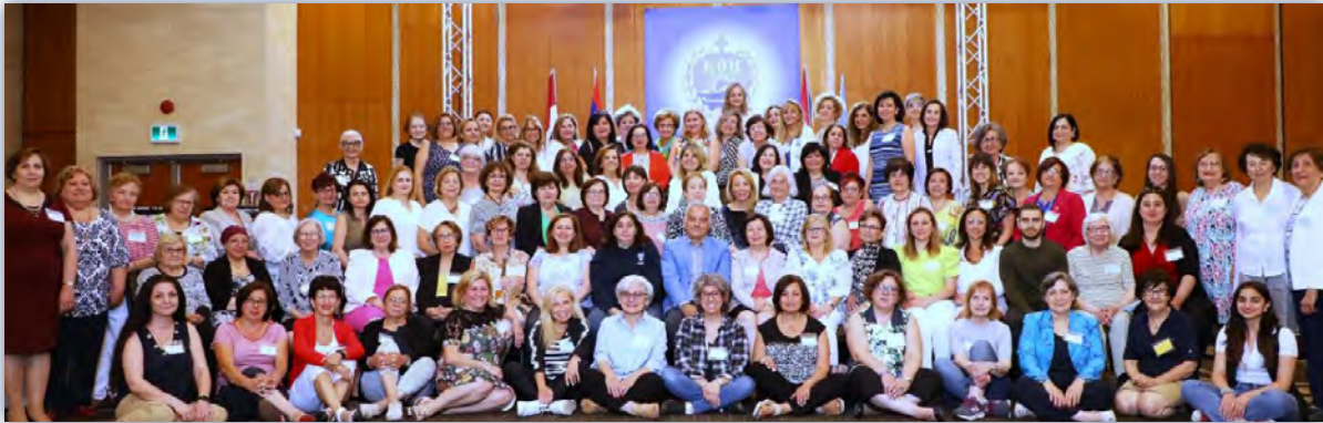
ARS Canada Regional convention, 2022