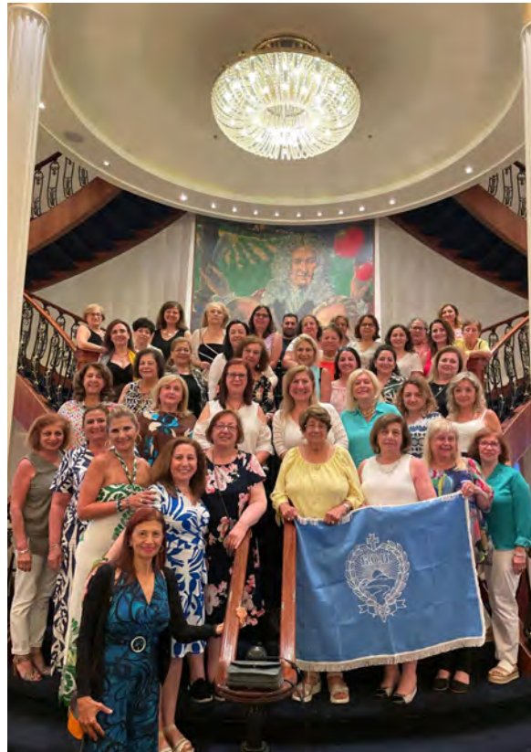
Regional Seminar Cruise 2024

As we stand on the shoulders of those who have come before us, we are inspired to continue this vital work. The challenges we face are indeed significant, but with our experienced members and our new members leading the way, we will continue to serve our people with compassion, dedication and steadfast commitment to our shared vision: "With the People, For the People" – 115 Years of Unwavering Service.