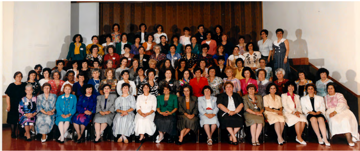
Regional Convention 1989-1990

մասնակցութեամբ: Այս մրցանքին նպատակն է քաջալերել հայ աշակերտները, որպէսզի մտածեն հայկական նիւթերու մասին, ընդարձակեն իրենց ընդհանուր գիտելիքները, զարգացնեն գրելու կարողութիւնները եւ կարելիութիւն ունենան քննարկելու շարադրութեան նիւթերը՝ ուսուցիչներու եւ դասընկերներու հետ: