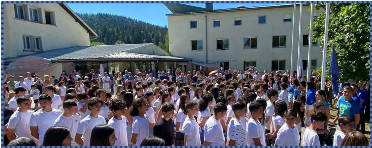
Bellefontaine Summer Camp, 2023

1980 թուականին ի վեր, Ֆրանսայի ՀՕՄը կրթաթոշակ տրամադրած է համալսարանական ուսանողներու: