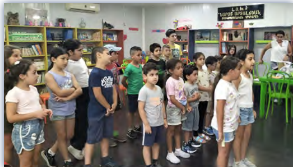
ԼՕԽ «Ն. Արտալճեան» Պարտէզ-Գրադարանի 6էն 12 տարեկան, 33 աշակերտներ, 17 Յունիսէն-12 Յուլիս, ամմոռանալի ամառ մը անցուցին