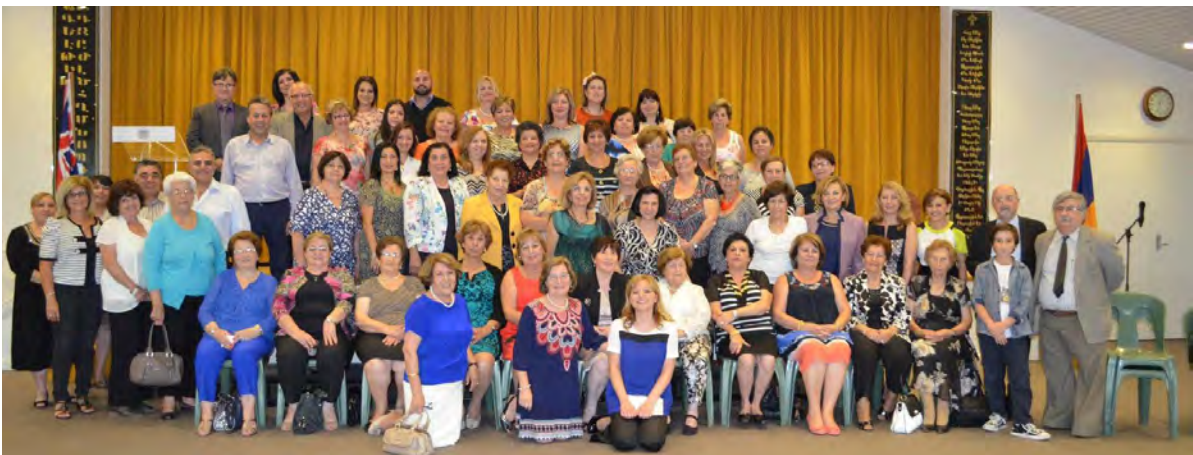
ARS members at the official ceremonies of the ARS-sponsored classrooms at the Hamazkayin Galstaun College