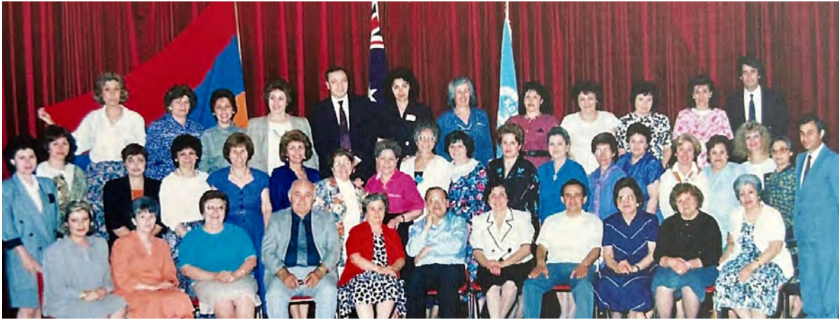
ARS Australia Second Regional Convention

րուն հետ սերտ շփում ունեցած եւ գործակցած եմ տարիներու ընթացքին: