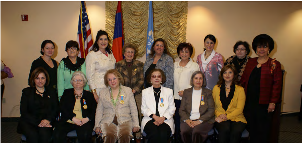
Mesrob Mashdots medal recipients, 2011