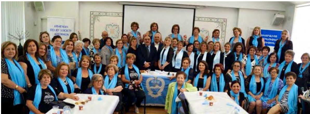
ARS Australia at Church Hall in Sydney following Requiem Mass 2019

PAGE SPONSORED BY ESHKHAN AND UNGH ESHKHANOUHI SIMONIAN