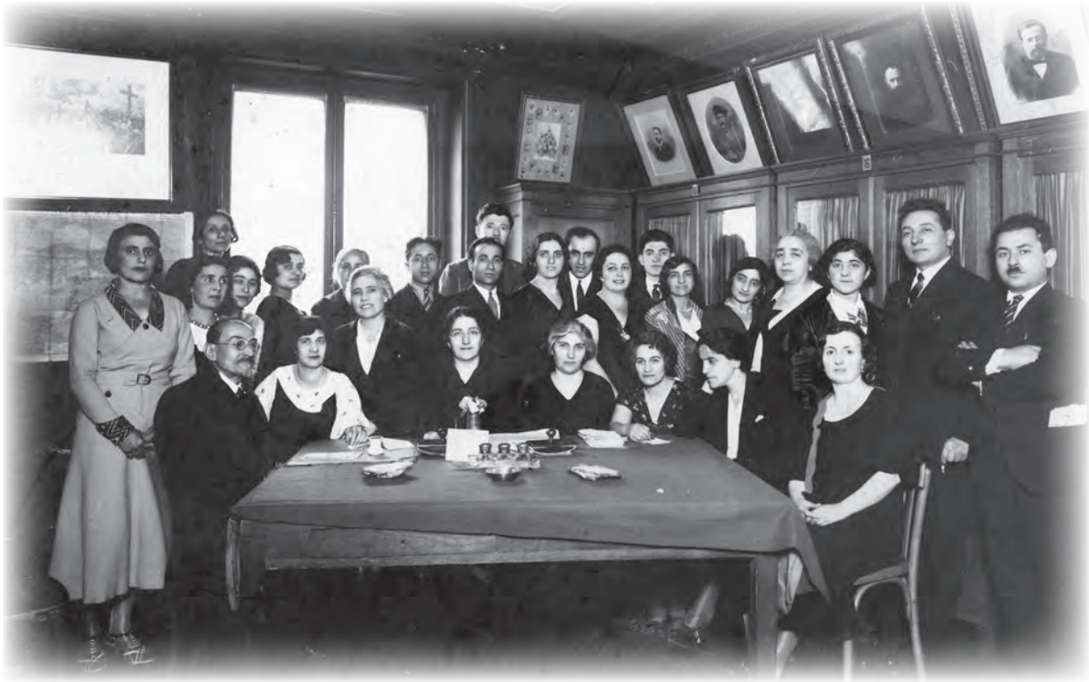
Paris Convention, 1933