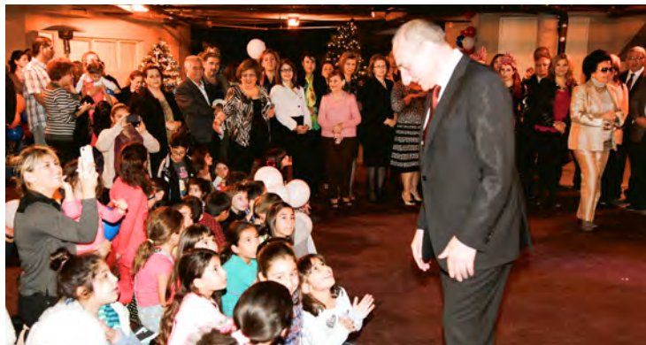
ARS Social Services Children's Thanksgiving Program 2014

ՀՕՄԻ 100-ամեակի խրախճանքը տեղի ունեցաւ Մայիս 16, 2010ին, Քալիֆորնիոյ Վուոլքլետ Հիլզ քաղաքին մէջ, ներկայութեամբ բանախօս Թաթուլ Սոնենց-Փափագեանի եւ Պարոնուհի Գարոլայն Քոքսի: Հարիւրամեակի գիրքի շնորհանդէսը տեղի ունեցաւ Յուլիս 10, 2010ին: Համագործակցելով Հարաւային Քալիֆորնիոյ համալսարանի Հայագիտութեան Հիմնարկի եւ Փրոֆ. Հրայր Տէքմէճեանին, Սեպտեմբեր 18, 2010ին, 100-ամեակի գիտաժողովը տեղի ունեցաւ USC Town and Gown Սրահին մէջ: