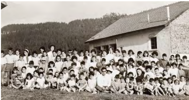
Bellefontaine Summer Camp, 1958

It is in this dynamic of humanitarian and social actions that the "khatchouies" of France project themselves, "With the people, for the people" and only ask to be joined by all those who, like their mothers and grandmothers, want to volunteer in the service of others providing assistance through various ARS programs serving children of fallen heroes, improving health and educational conditions in Armenia and empowering women.