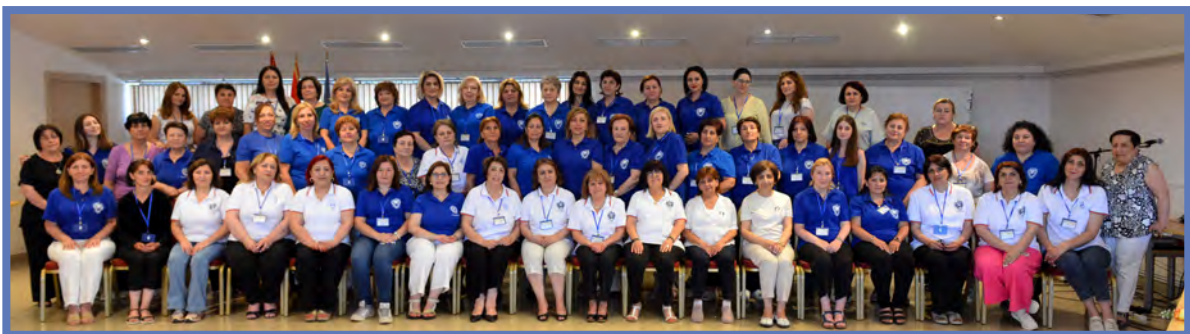
Armenia 30th Regional Convention