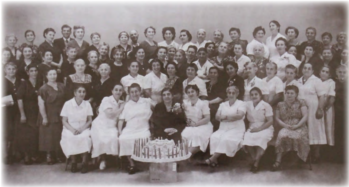
ARS 50th Anniversary 1960, Fresno, California