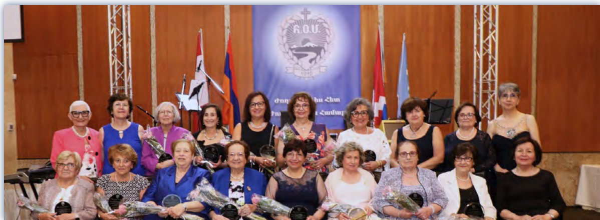
Members honoured by ARS Canada regional for their long time services, 2022 ( 30th anniversary)

Յարաբերական. - Շրջանային վարչութիւնը սերտ յարաբերութիւններ մշակած է ուղեկից միութիւններու, օտար կազմակերպութիւններու հետ ընդառաջելով յղուած հրաւերներուն: ՀՕՄի ներկայացուցիչներ ներկայ գտնուած են Ազգային Առաջնորդարանի երեսփոխանական ժողովներուն, ՀՅԴ Կեդրոնական Կոմիտէի, յարանուանութիւններու եւ քոյր միութիւններու այլազան ձեռնարկներուն, յատկապէս՝ Հայոց Ցեղասպանութեան 100-ամեակի