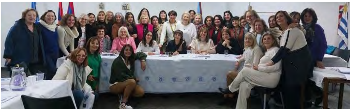
ARS South America 56th Regional Convention 2023

PAGE SPONSORED BY ARS WESTERN USA NAIRY CHAPTER