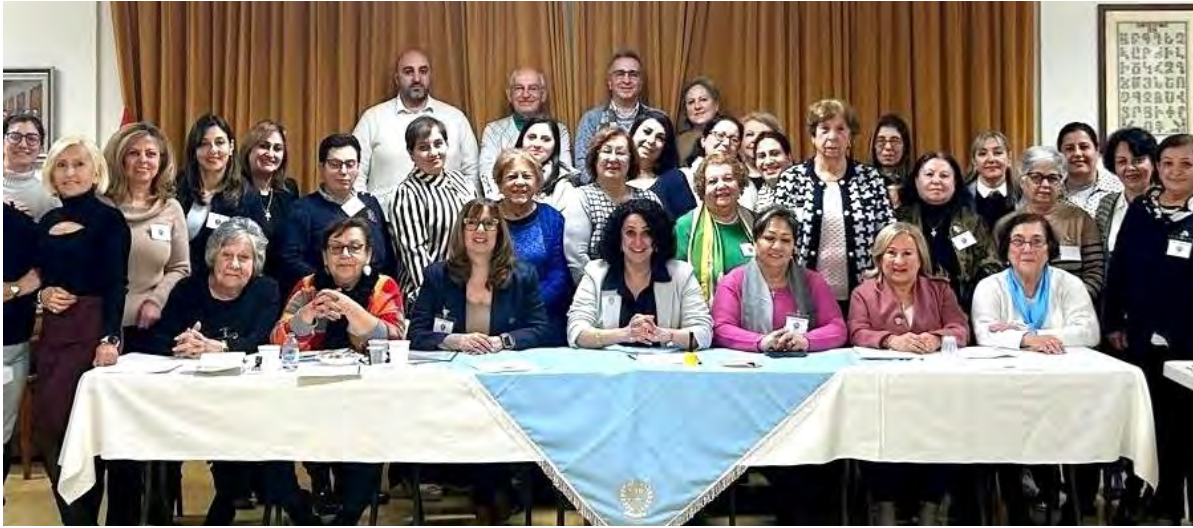
ARS Australia 41st Regional Convention 2024

Մայրերու Օրուան առիթով մաս կազմեց Mothers Day Classic Walk դրամահաւաքի քայլարշաւին, առ ի զօրակցութիւն կուրծքի քաղցկեղէ տառապող հիւանդներուն: