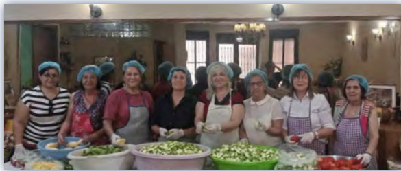
ԼՕՄի «Վ. Տէկիրմէնճեան» խոհանոցի «Տաք Ծառ» ծրագիրը կը շարունակուի շնորհիւ ԼՕՄի Կեդրոնական Վարչութեան եւ բարերարներու աջակցութեան