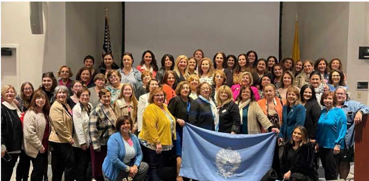
Regional Seminar New Jersey