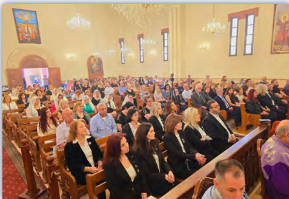
ԼՕԽի ննջեցեալ անդամուհիներու եւ բարերարներու յիշատակին, հոգեհանգստեան պաշտօն կատարուեցաւ Կիրակի, 15 Մայիս 2024ին, Պուրճ Համուտի Սրբոց Վարդանանց եկեղեցոյ մէջ