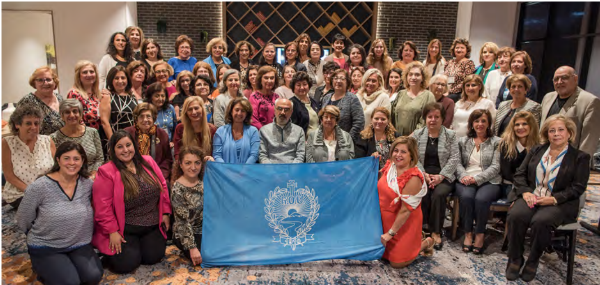
ARS EUSA 100th Regional Convention

թոշակ: Այս կրթաթոշակը հիմնադրուած է 2018ին՝ աջակցելու ԱՄՆ-ի հայ այն ուսանողներուն, որոնք կը փափաքին բարձրագոյն կրթութիւն ստանալ Հայաստանի մէջ: