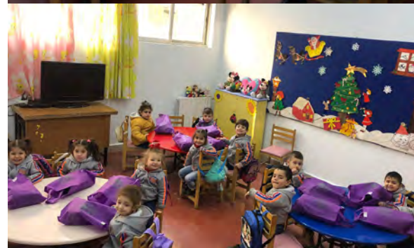
«Տաքուկ Զգեստներ» Ծրագիր