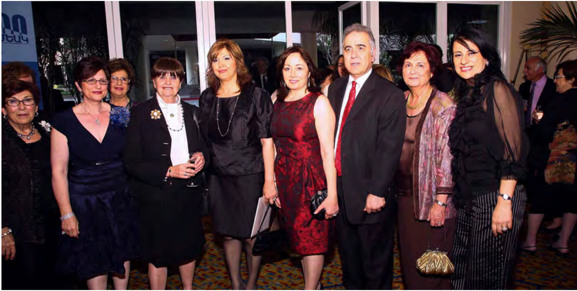
ARS 100th Anniversary Gala with Baroness Carolyn Cox, 2010

kindergartens that the region sponsored in Ashan and Agnapert, the new 4-story kindergarten building in Stepanakert, as well as the loss of one of the latest beneficiaries of the region's major donation: the solar water heater project sites in Artsakh. The last pilgrimage to Artsakh was held April-May, 2015.