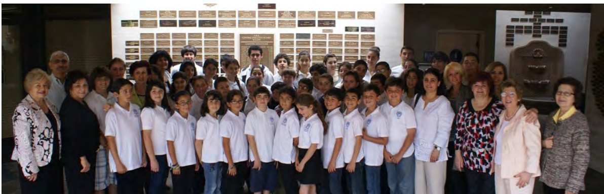
ARS One Day School Program

PAGE SPONSORED BY ARS WESTERN USA FRESNO MAYR CHAPTER