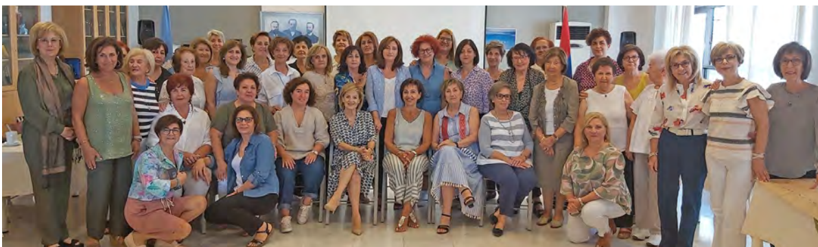
84th Regional Convention

Միաւորը կը մասնակցի ՀՕՄԻ Կեդրոնական վարչութեան բոլոր ծրագիրներուն: