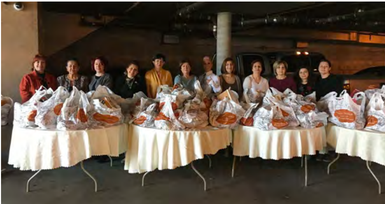
ARS Social Services volunteers distribute Thanksgiving meals to clients