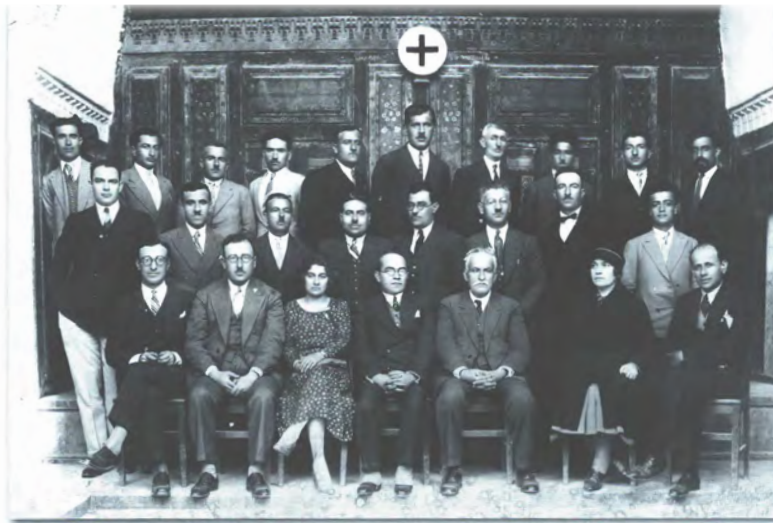
Մ.Օ.Խաչի Ա. Պատգամաւորական Ժողովը, 7 Ապրիլ 1931ին