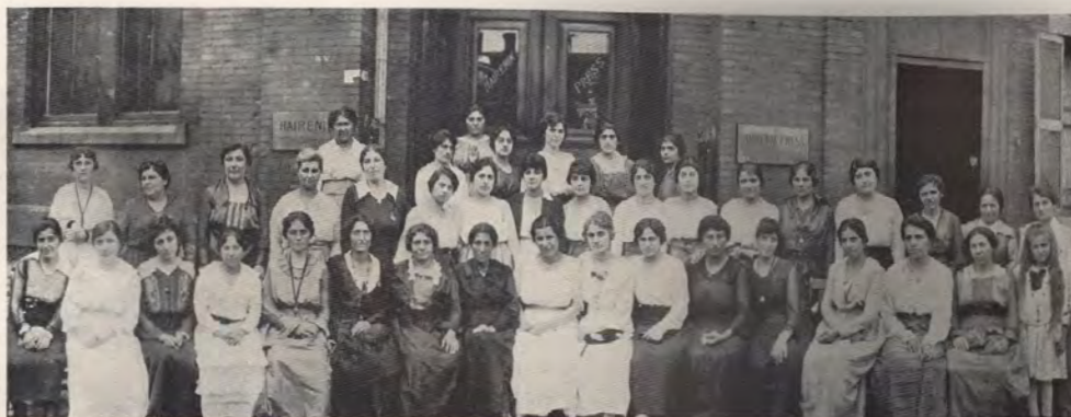
Բ. ՊԱՏԳԱՄ. ԺՈՂՈՎ (Փոստալական Փոստան, 1919, Յուլիս 2-5)