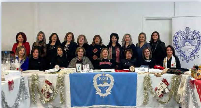
Պաշար Նոր Տարուայ ստեփի 10/12/2022

During the last few years, the chapter organized events such as International Women's Day, Mother's