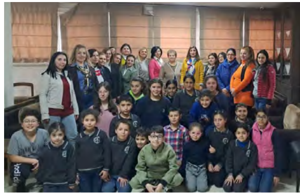
ՍՕԽճի Ազգ. Պատսպարան

ընդարձակման, շնորհիւ ՀՕՄԻ Գանատայի միաւորի նիւթական օժանդակութեան: