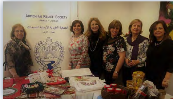
The annual bazaar

distributing monthly pantry supplies to ease their daily financial burdens and providing financial assistance to those who need medical care.