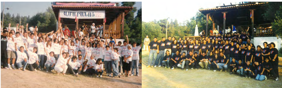
Chalkidiki Youth Camp

Ի՞նչ է ՀՕՍը, եթէ ոչ հայ նուիրեալի տունը, հայ սրտի հաւաքական կերպարը, ուր ինձի պէս ազգային տարերքէն տառապողներ կրնան ամոքել իրենց կսկիծը վերածելով զայն ուժի, յոյսի եւ նուիրումի: