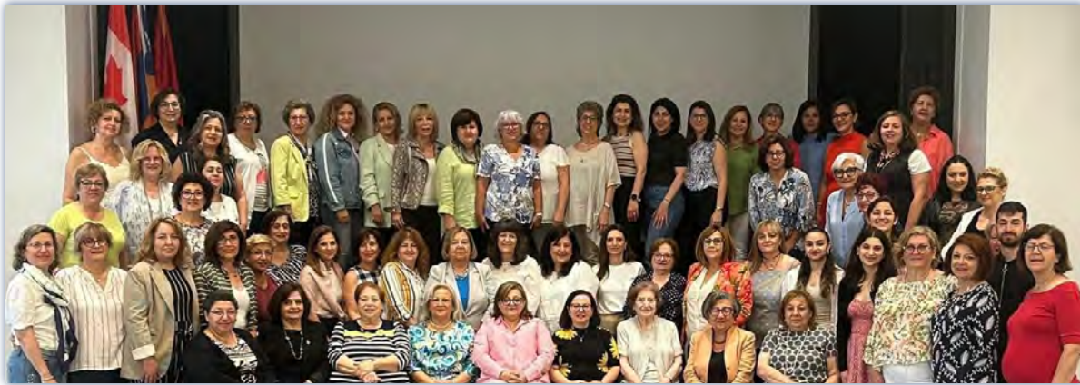
ARS Canada Regional Bi-annual seminar, 2024

aid depot, where donations of clothing, food, and medical supplies poured in. The ARS worked tirelessly, day and night, to ensure that every box made it to those in need. That same spirit of urgency, dedication, and love continues to define the ARS to this day.