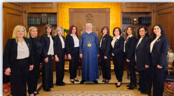
ԼՕԽի Շրջանային Վարչութիւնը, 27 Փետրուար 2024ին, այցելեց ՆՍՕՏՏ Արամ Ա. Վեհափառ

«Ա. Պուլղուրճեան» ընկերաբժշկական կեդրոնը, կարիքաւորներու թիւի աճի պատճառով, կը գործակցի տեղական ոչ կառավարական կազմակերպութիւններու հետ, ինչպէս՝ Amel, WHO, YMCA, PU, AFD... կազմակերպե-