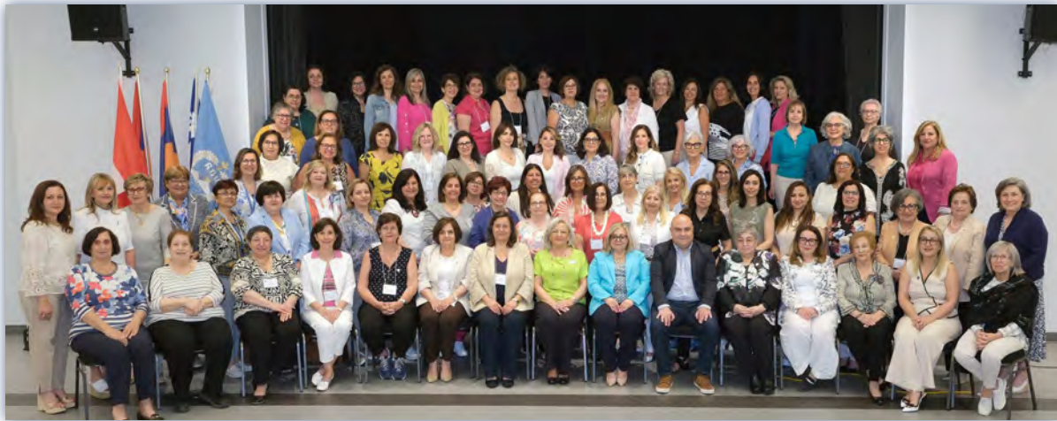
ARS Canada Regional convention, 2025 ( 35th anniversary)

Saturday Schools, Summer Camps, Nurseries and Kindergartens.