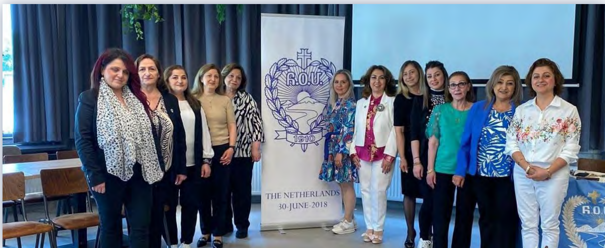
Ծանօթացման Հանդիպում (Արմինե) 02/06/2024