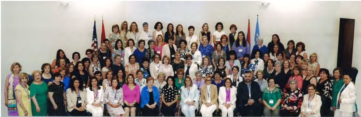
ARS 99th Regional Convention 2024